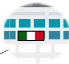
Italian Pavilion located at Premium Area of the Exhibition